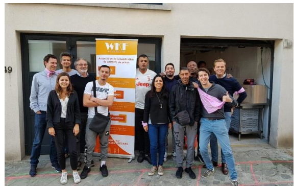
Atelier recherche d'emploi avec les bénéficiaires de Wake up Café