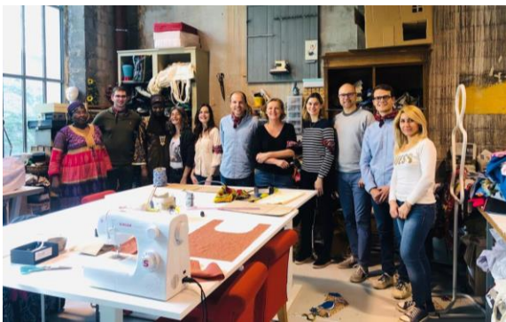
Menuiserie et couture avec les salariés en insertion d'Emmaüs Défi